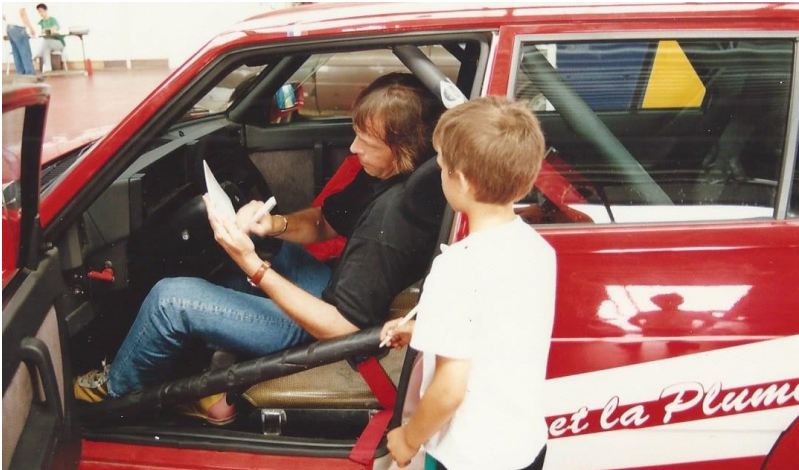
Présence de quelques VIP de l'époque, le chanteur Pierre BACHELET signe un autographe pour Marc-Emilien !