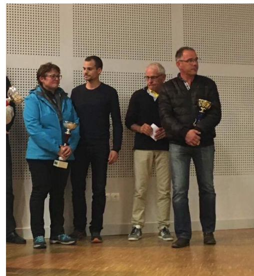
La remise de la Coupe