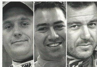
AMATEURS ILS ONT FAIT L'ALSACE !