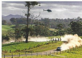
ANALYSE OÙ VA LE WRC ?