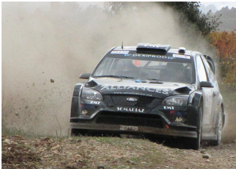
La Ford FOCUS WRC à l'arrivée de l'ES3