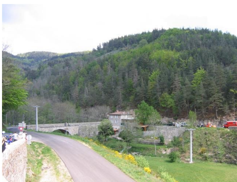
Dans l'ES 4

Les ES 2 et 4 reprenaient une partie d'une ES du Monte Carlo 2007 près de Saint Bonnet le Froid et l'ensemble du rallye traverse des paysages magnifiques.