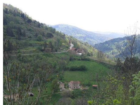
Route vers St Bonnet le Froid

L'après-midi, Paul BIZALION, alors 2ème au général, abandonnait à l'issue de l'ES 5 sur problème mécanique.